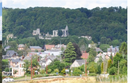
Les vestiges vus de la rue de la Ferrière

Pour la zone en rose foncé dans le périmètre de 500m