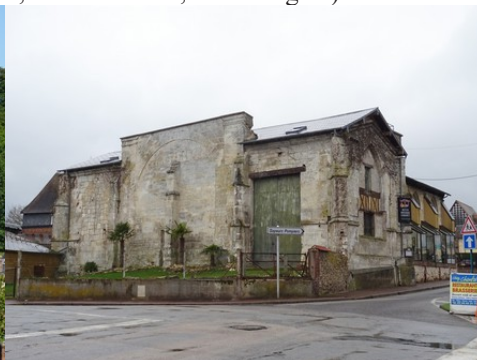
L'ancienne église de Vieilles (reconvertie)