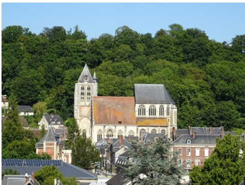
L'église Saint-Nicolas (classée MH)

Les avis seront cohérents avec ceux émis ces dernières années, à savoir : pas de maisons à volume compliqué (type V, W, Y, ou Z), pentes à 45° pour les volumes principaux, ardoise ou tuile plate de teinte brun vieilli, à 20u/m², avec un débord de toiture de 20cm, enduit de teinte beige clair avec modénatures (au choix : chaînages, encadrement de fenêtres, soubassement, colombage...). *Voir les autres fiches.