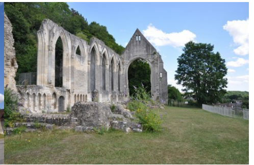
Les vestiges de l'église abbatiale