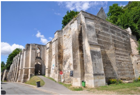
La muraille de soutènement