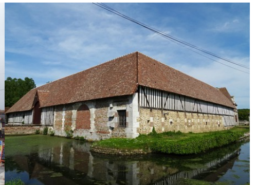
Le manoir du Hom (inscrit MH)