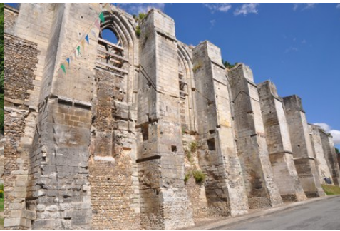
Les contreforts de soutènement