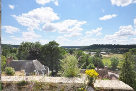
La vue vers la vallée de la Risle au Sud