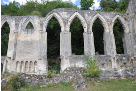
Les arcs brisés de l'ancienne face nord