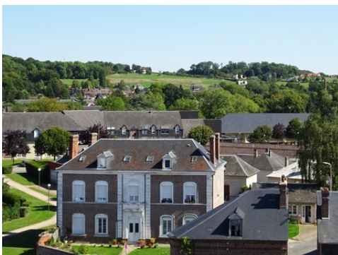
Une vue sur Beaumont vers l'Est