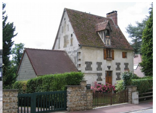
La réutilisation des pierres de l'abbaye