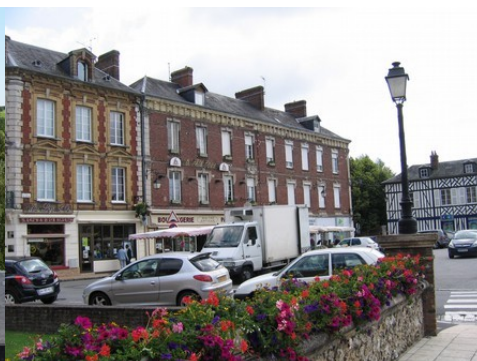
Les façades : brique, pierre ou colombage